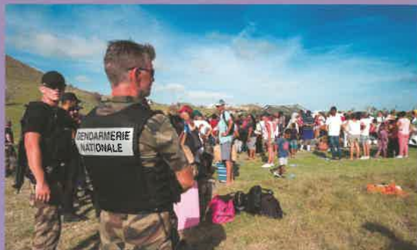
Être projeté Outre-mer (ex cyclone Irma à St Martin)