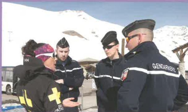
Participer à la sécurisation des zones de vacances