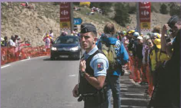
Assurer la sécurité du Tour de France