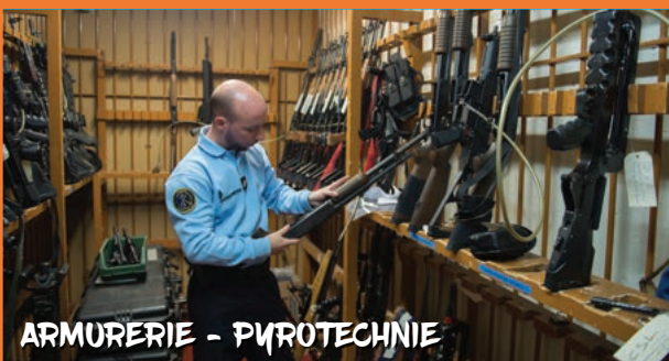
ARMURERIE - PYROTECHNIE