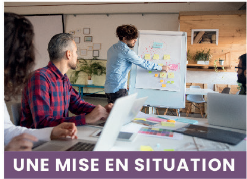
UNE MISE EN SITUATION